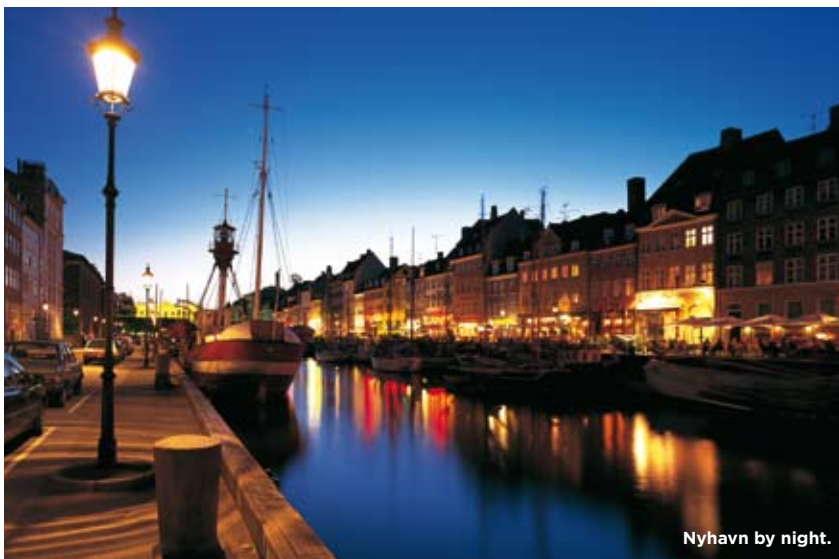
Nyhavn by night.

Staden är en av Europas mest säkra, men ficktjuvar finns även i Köpenhamn. Det är många, bland annat svenskar som åker till Köpenhamn och fester. De flesta hamnar runt Strøget, vilket innebär att det inte är ovanligt med diverse fylleslagsmål däromkring. Droger florerar runt Centralstationen, och vissa gator i Vesterbro bör inte besökas på egen hand nattetid.