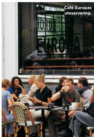
Café Europas uteservering.

SØREN K. Restaurangen, som ligger i Kungliga biblioteket, är snygg med öppna rena ytor. Maten är superb och lunchen kostar cirka 110 danska kronor, dagens fisk är ett gott val. En trerättersmiddag får du för närmare femhundra och här är det foie gras,