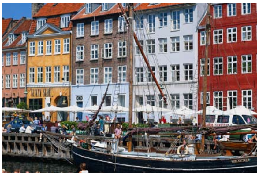
Färgglatt, folkligt, Nyhavn.

NYHAVN i holländsk kanalstil har blivit en institution. Färgglatt och folkligt ligger Nyhavn vid Kongens Nytorvs nordöstra hörn. För i tiden var kanalen tillhåll för prostituerade och deras kunder, i dag kantas bryggorna av kaféer och barer. Kanalen grävdes av soldater 1671-73 och gjorde det möjligt för handelskepp att nå Kongens Nytorv. På torget ligger Det Kongelige Teater. På vintern gör man isbana här, till stor glädje för alla som tycker om att åka skridskor.