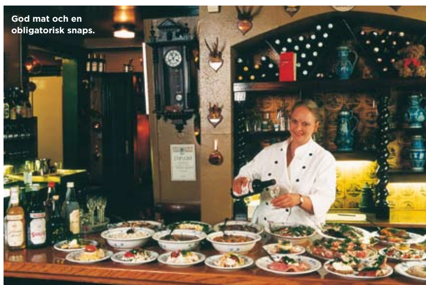
God mat och en obligatorisk snaps.

📍 Sankt Hans Torv 32, tel 35-36 30 02. Öppet mån-tors 08-01, lör 08-08 och sön 09-02. Köket stänger 23 varje kväll.