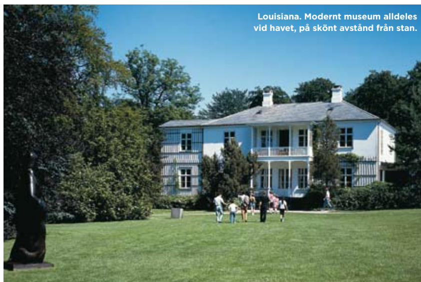
Louisiana. Modern museum alldeles vid havet, på skönt avstånd från stan.

📍 Fredriksgade 4, tel 33-15 0144, www.marmorkirken.dk . Öppet mån-tors, 10-17, fre-sön 12-17. Gratis inträde.