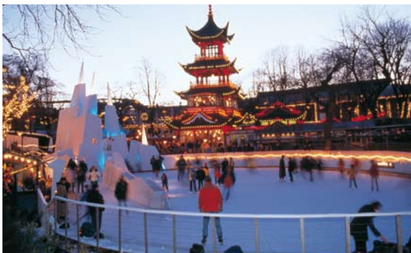
Tivoli. Skojigt året runt.

📍 Købmagergade 32, tel 33-1294 03. Öppet mån–tor 10–18, fre 10–19, lör 10–15.