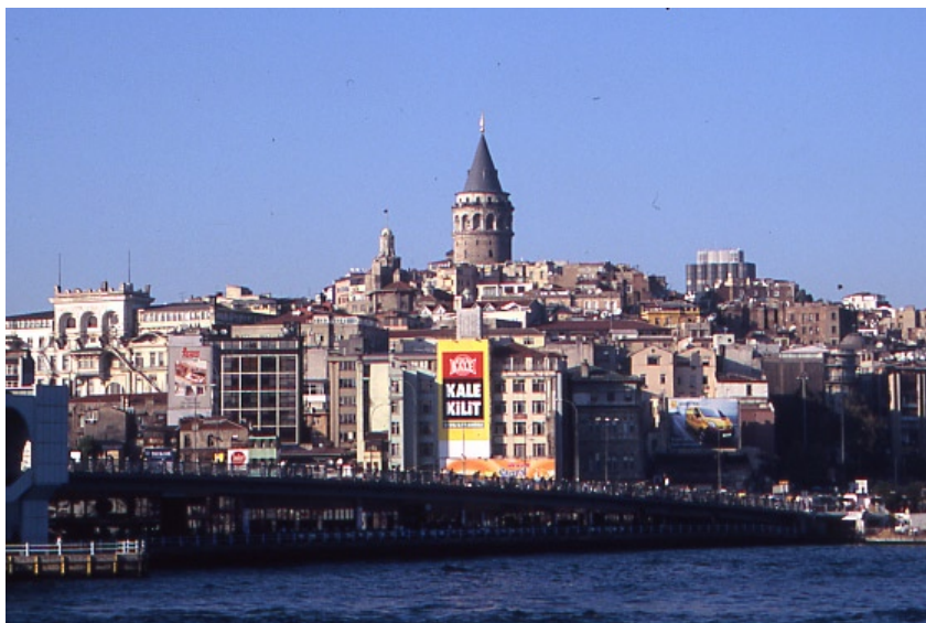
Istanbul är världens enda stad belägen i två världsdelar, Europa och Asien.

GALATA bär på ett förflutet som venetiansk och genuesisk handelskoloni. Vindlande gränder letar sig upp för branta backar, förbi tegeltak och tunga fasader till Galatatornet som är ett av traktens bästa orienteringsmärken.