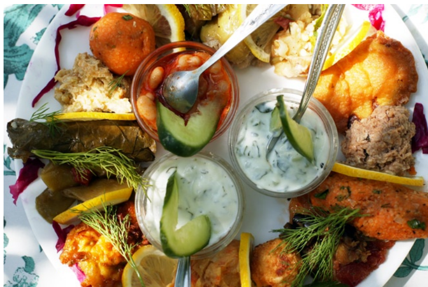
För öga och gom. Mezes, smårätter.

📍 Asmalimescid Caddesi, Sofyali Sokak 10, Tünel, Beyoglu, tel 0212-243 28 34. Öppet 12.00-24.00.