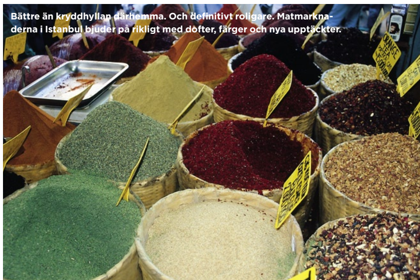
Bättre än kryddhyllan därhemma. Och definitivt roligare. Matmarknaderna i Istanbul bjuder på rikligt med dofter, färger och nya upptäckter.

📍 Hasnun Galip Sokak 20, tel 0212-245 05 16, www.jazzcafeistanbul.com . Öppet 12.00-02.00.